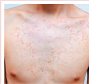
▶上背、胸口的亦是暗瘡。