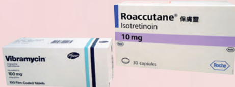
▶口服藥物四環素抗生素（左）及維他命A（右）適合中度至嚴重暗瘡患者使用。

中度及嚴重患者亦要做足以上改善措施，亦可以配合口服藥物治療，分為三類。第一類為四環素抗生素及紅霉素抗生素，有效殺菌及消炎，療程大概需時一至三個月。第二類是避孕藥，醫生處方此藥前需要與患者溝通，女士若有暗瘡問題，同時經期問題或有避孕需要，可以選擇此藥。第三類為口服維他命A或二維A酸，是最有效的暗瘡藥，療程為四至六個月，但並非所有病人適用，因為維他命A會減少油脂分泌，可以引致服食者皮膚乾燥，若本身有濕疹的患者濕疹可能會更加嚴重。其他不常見副作用包括：長時間服用可能會影響肝功能及影響血液內三脂甘油的水平。