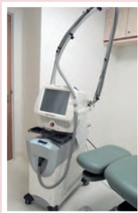
▶分段激光機可以有效刺激真皮層骨膠原的增長，令皮膚回復飽滿，改善暗瘡凹凸洞。

增生性疤痕其實是粉紅色的肉芽，可以注射類固醇至增生疤痕使其萎縮及變薄，接着再使用激光處理疤痕的顏色。☺