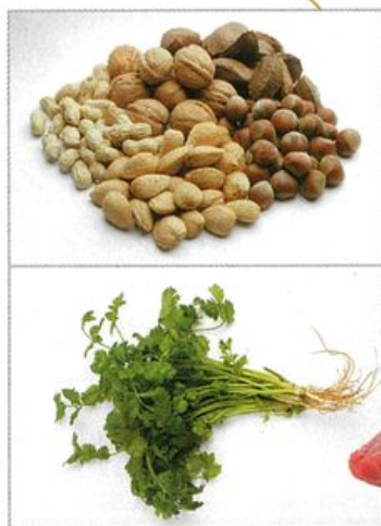
▲►紅肉、綠葉蔬菜及乾果類，都是含豐富鐵質的食物之一。

鐵質是血紅素的必要元素，缺乏鐵質便會引致貧血。鐵質不足可以是因為過度流失或吸收不足引起。經血過多、腸道出血是鐵質流失的常見原因；鐵質吸收不足則包括偏食、茹素、鐵荒等原因而導致貧血，他建議素食者可透過進食高鐵質食物，或相關的營養補充劑來改善問題。