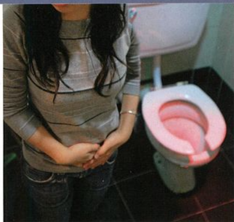
▲貧血有機會與女性經期有關，可透過婦科檢查及超聲波檢查，了解背後的狀況。